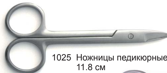
1025 Ножницы педикюрные, 11.8 см