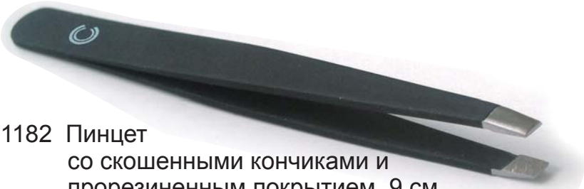
1182 Пинцет со скошенными кончиками и прорезиненным покрытием, 9 см