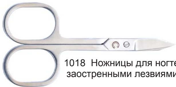
1018 Ножницы для ногтей с прямыми заостренными лезвиями, 9.2 см