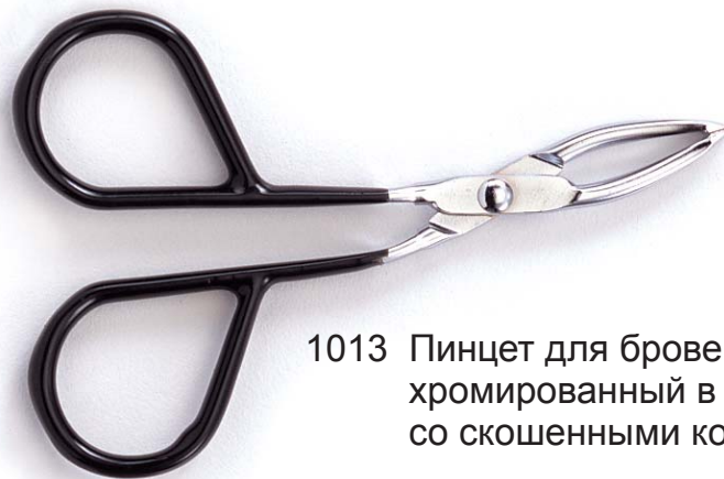
1013 Пинцет для бровей хромированный в виде ножниц со скошенными кончиками, 8.2 см