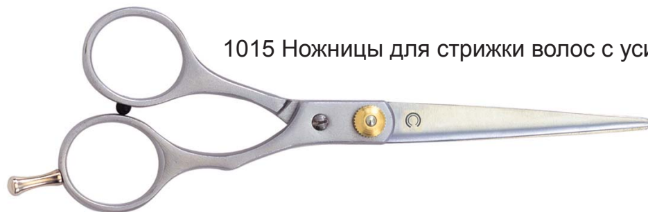
1015 Ножницы для стрижки волос с усилителем, 15.2 см