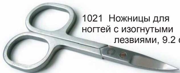
1021 Ножницы для ногтей с изогнутыми лезвиями, 9.2 см