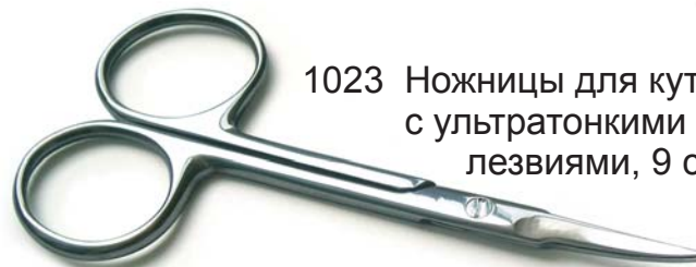
1023 Ножницы для кутикулы с ультратонкими изогнутыми лезвиями, 9 см