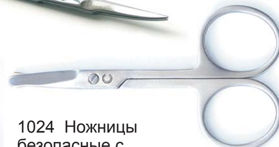
1024 Ножницы безопасные с закругленными кончиками, 8 см