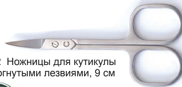
1022 Ножницы для кутикулы с изогнутыми лезвиями, 9 см