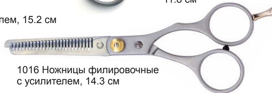
1016 Ножницы филировочные с усилителем, 14.3 см