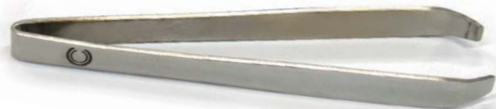
1008 Пинцет со скошенными кончиками, 7.5 см