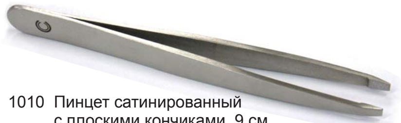
1010 Пинцет сатинированный с плоскими кончиками, 9 см