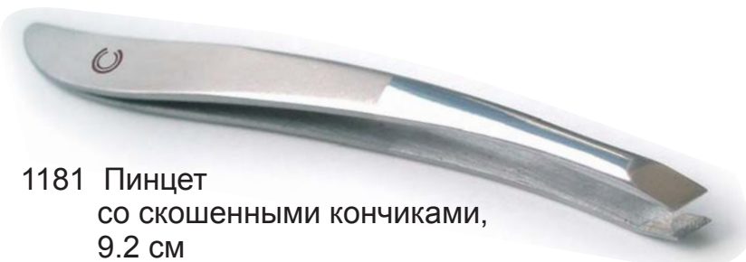
1181 Пинцет со скошенными кончиками, 9.2 см