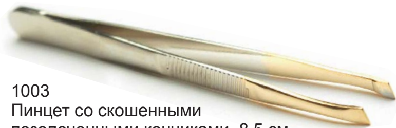
1003 Пинцет со скошенными позолоченными кончиками, 8.5 см