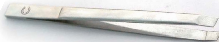
1180 Пинцет со скошенными кончиками и зеркальной поверхностью, 7.9 см