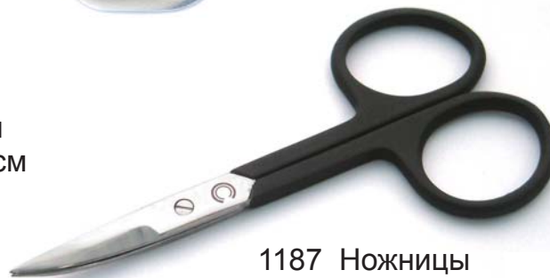
1187 Ножницы для ногтей с изогнутыми лезвиями и прорезиненными ручками, 9.3 см