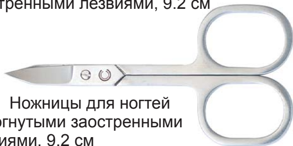
1019 Ножницы для ногтей с изогнутыми заостренными лезвиями, 9.2 см